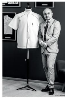
Jordan | Commercial BRAGARD